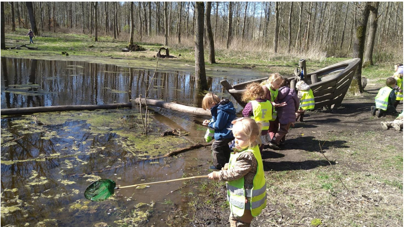
Leg og børnefællesskaber

Vi skal på tur i området, og børnene står klar ved lågen. En af børnene vil ikke holde et andet barn i hånden. Jeg spørger hvorfor A ikke vil holde B i hånden. A svarer at B slår ham. Jeg siger, at vi passer på dig og holder øje med, hvordan det går på turen. Efter lidt betænkningstid tager A så B i hånden. Senere spørger jeg A om, hvordan han synes, at turen gik. A svarer godt og ser glad ud. Da vi skal hjem fra turen tager de to børn hinanden i hænderne uden protest.